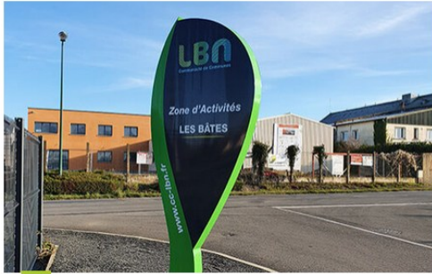
La LBN gère 17 zones d'activités pour soutenir sa dynamique industrielle et agricole

Cette fiscalité modérée permet de développer le tissu économique, d'attirer de nouvelles entreprises sur notre territoire et, dans un système vertueux, d'augmenter nos recettes fiscales. En 2023, les recettes fiscales atteignent 5,8 M€, elle s'élève cette année à 6,1 M€.