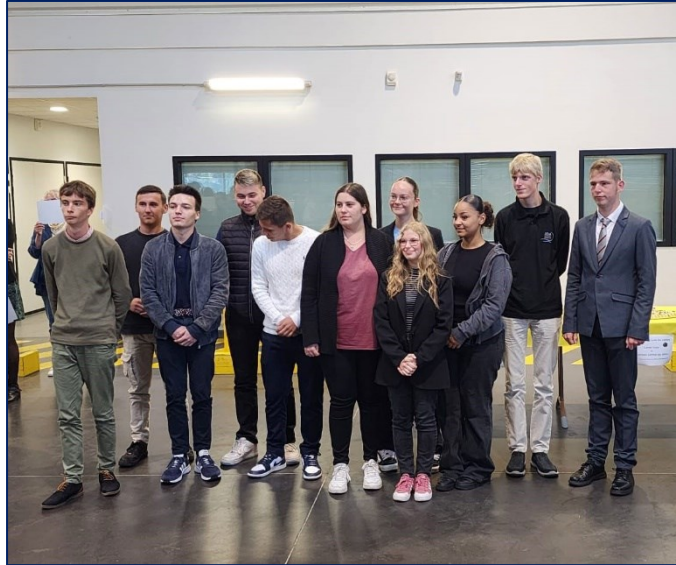
Les 12 candidats finalistes du CGM spécialités OTM

Un partenaire professionnel B2PWeb a formé les candidats et leurs accompagnants la veille de l'épreuve à l'utilisation d'une bourse de Fret en ligne